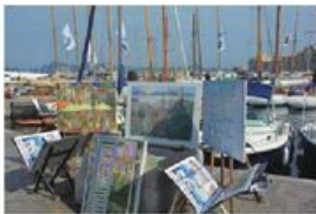
很多画家在二十世纪早期来到这个“画家之城”

圣特罗佩每年吸引着将近500万游客前往， 可以说是世界上最受欢迎的小镇之一。 这个仅有5000个居民的古老渔港是如何吸引众多的游艇停靠？