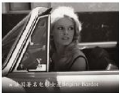
» 法国著名电影女星Brigitte Bardot

很久之前，圣特罗佩就与迪奥、爱马仕等奢侈品牌，夜店、大型游艇以及众多的别墅和五星级酒店联系在一起。